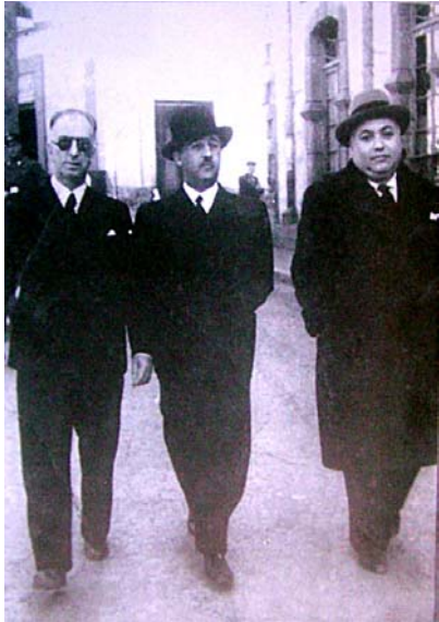
Franco, en el centro, paseando por Ceuta en 1935