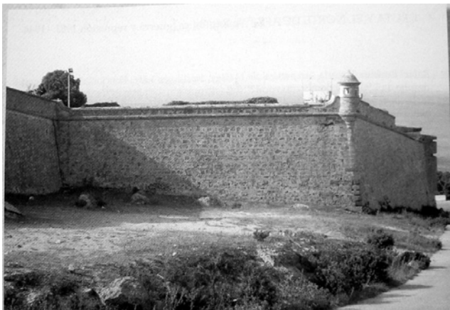
Fortaleza del Monte Hacho Ceuta