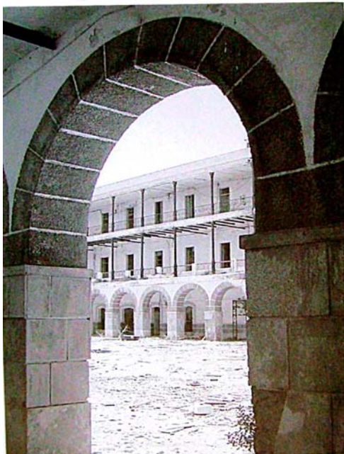
Acuartelamiento del Batallón de Cazadores del Serrano nº 8 Patio Central